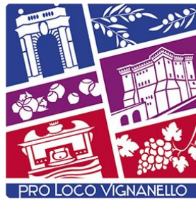
Giardino all'Italiana, Castello Ruspoli