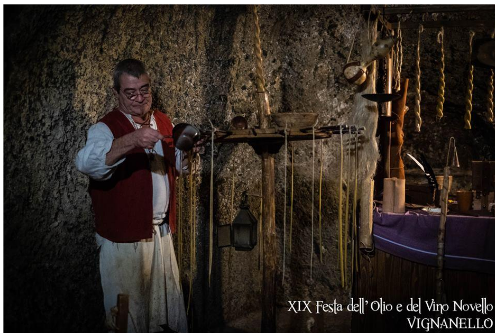
XIX Festa dell' Olio e del Vino Nuovo VIGNANELLO