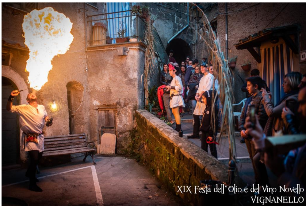
XIX Festa dell' Olio e del Vino Nuovo VIGNANELLO